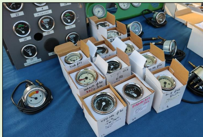
Mooie klokjes op de ruilbeurs

De ruilbeurs op 10-10-2021 in Oud Gastel wisten zowel de standhouders als de bezoekers wel te vinden. Ruim 1000 bezoekers waaronder mensen die 3 uur in de auto hebben gezeten om weer eens “Los” te mogen zoals een aantal bezoekers wisten te vertellen. De locatie aan de Slotstraat in Oud Gastel is vanaf de A17 goed te bereiken, voldoende parkeer gelegenheid en volop mogelijkheden om binnen of buiten te staan.