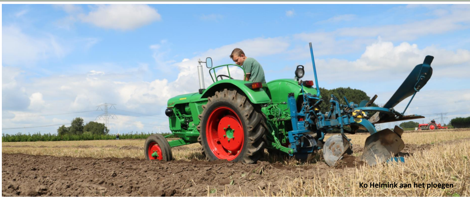
Ko Helmink aan het ploegen