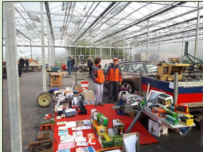
Overdekt met je stand, dit is mogelijk in Oud Gastel

Op een nieuwe locatie en op een andere datum een ruilbeurs organiseren is altijd een risico; “Komen de bezoekers wel?”