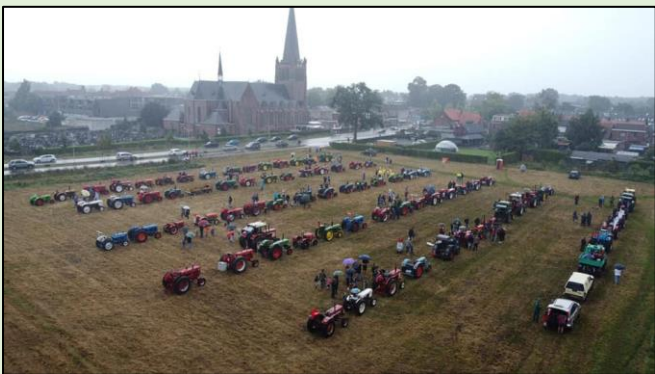
Tussenstop in Hoogerheide, stromende regen en opstelling volgens Corona maatregelen.