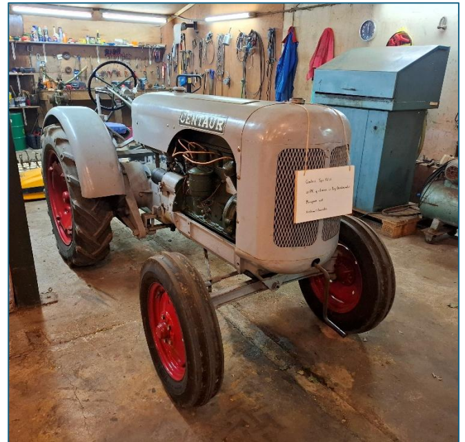
Centaur in de werkplaats

trekkers gebouwd in Greenwich. De kleine trekkers werden vooral gebruikt op tuinderijen in boomgaarden en bij kleine boeren. Gedurende WOII stopte de productie van dit merk.