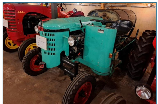
Biefer spuitrekker uit Zwitserland

Tot slot noemen we een Biefer spuitrekker uit Zwitserland.