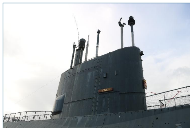
Onderzeeër van het Marine Museum in Den Helder

de rede en de veerboot heeft moeite om aan te meren. Zo voelt code oranje dus, snel de onderzeeër in om te ervaren hou benauwd het is om in dit vaartuig opgesloten te zitten. Hier moet je echt samenwerken en elkaar de ruimte gunnen want anders is het niet te doen. In het museum en loodsen is natuurlijk veel meer te zien over het ontstaan, geschiedenis en het heden van de Nederlandse Marine. De vele vrijwilligers vertellen met zichtbare trots over de Marine en de heldendaden.