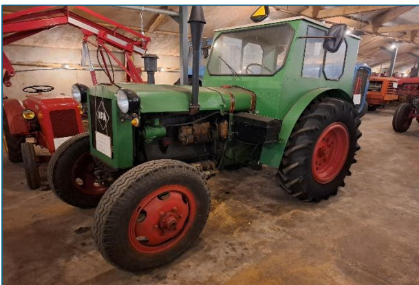
IFA Pionier uit de DDR