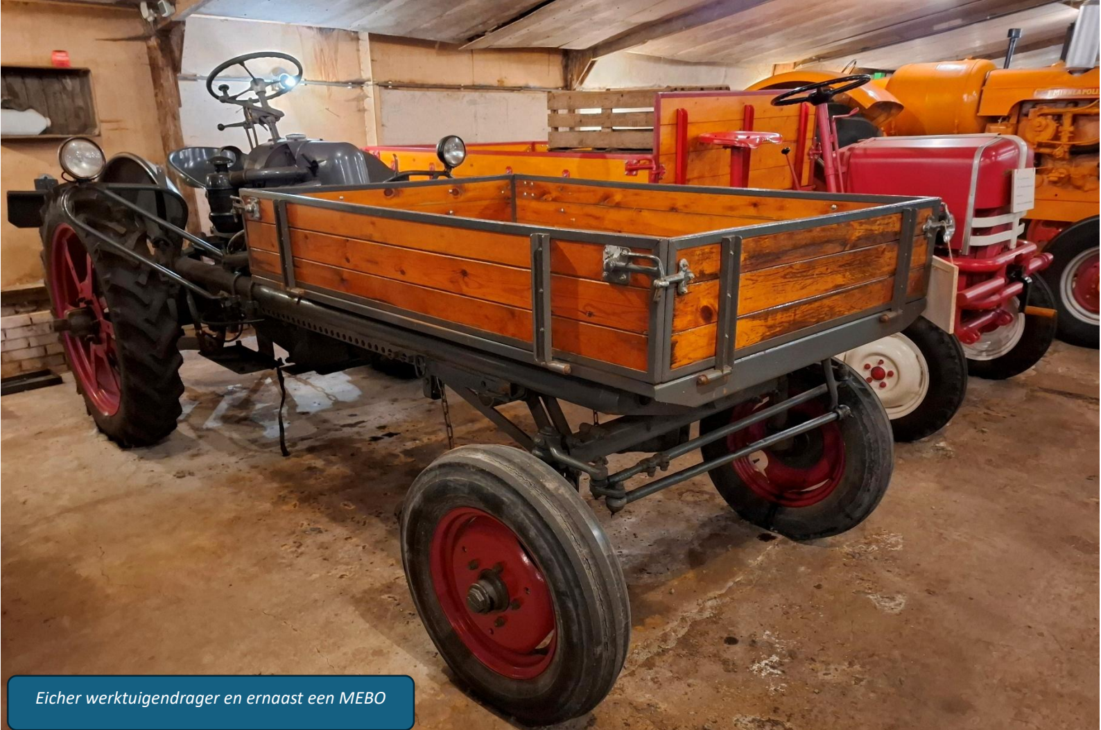
Eicher werktuigendrager en ernaast een MEBO