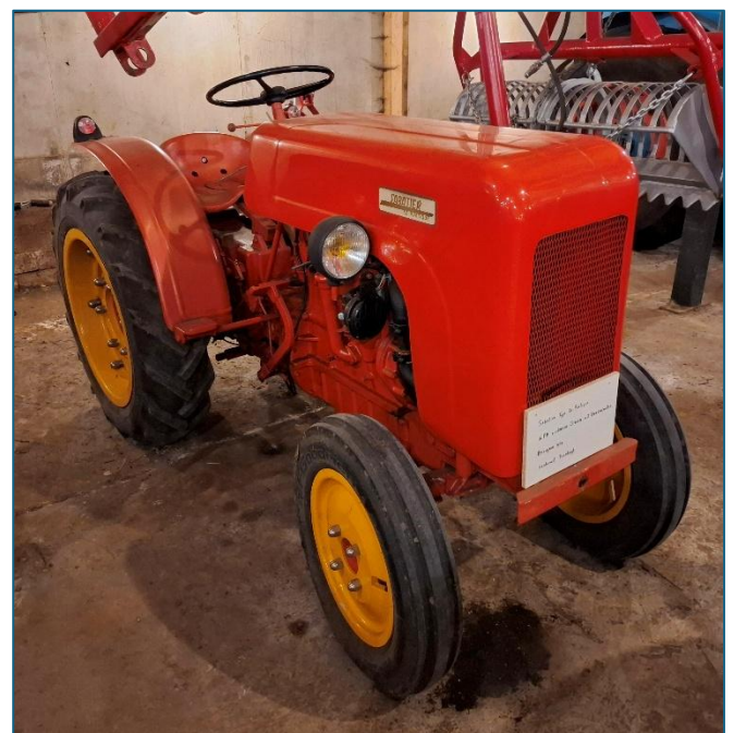
Sabatier "Le Pratique"

Verstopt tussen een paar grote trekkers vinden we een Franse Sabatier "Le Pratique". Als je oog in oog met deze trekker staat valt op hoe klein deze is. Een echt tuinbouw en wijngaard trekkertje voorzien van een 16pk viercilinder Citroen benzinemotor. Op een folder staat de trekker afgebeeld met een 2 schaar wentelploeg en een messenmaibalk.