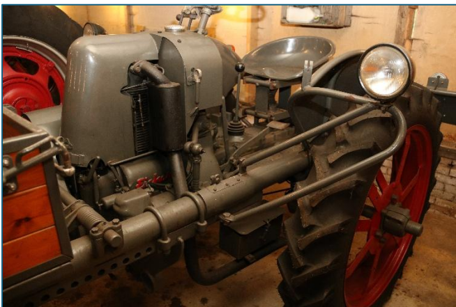
Detail van de Eicher werktuigendrager'.

Naast de MEBO staat een Eicher werktuigendrager G19 kombi uit 1957. Bij deze machine zit de chauffeur boven de achteras. Tussen de chauffeur en de laadbak een eencilinder Eicher motor (ED16-1) met directe inspuiting van 19pk. De werktuigendrager staat er in perfecte staat en is een juweeltje in de verzameling.