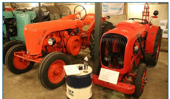
Rechts de Arnoux en links de OTO C25

De Arnoux smalspoor tuinbouw trekker is gebouwd in Frankrijk en heeft een Deutz F2L712 tweecilinder dieselmotor van 25pk. De koplampen zijn achter de grill van de motorkap gemonteerd. De fabrikant is bij