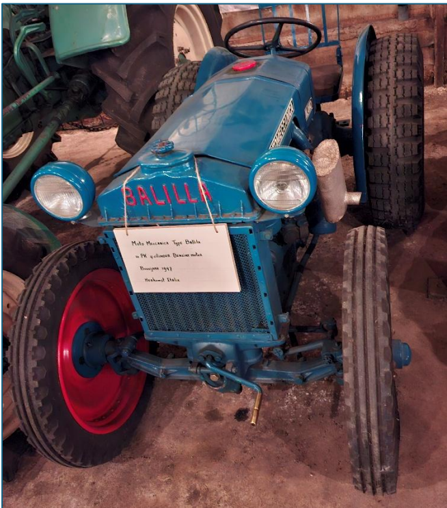
Balilla 10pk trekker van Motomeccanica uit Italië

Ook een klein trekkertje is de 10pk sterke Balilla trekker van de fabrikant Motomeccanica uit Italië.