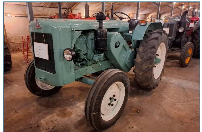
Lombardini TL 40, erachter een Landini gloeikop