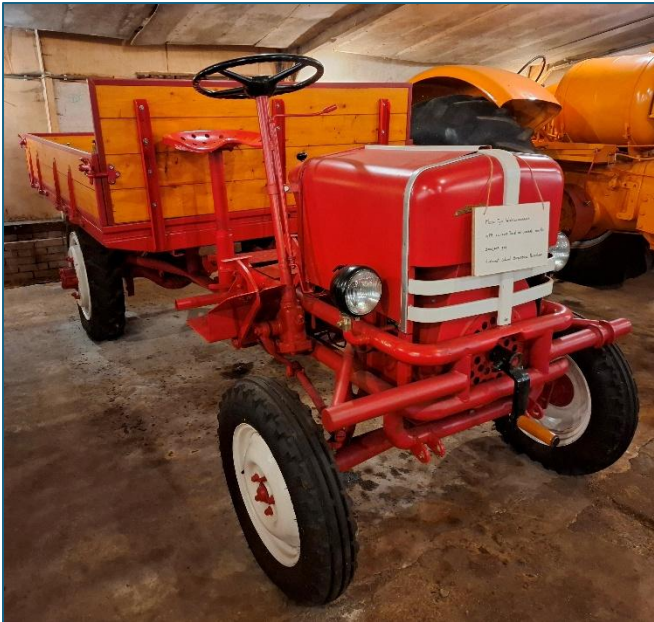
MEBO, een van de pronkstukken uit de verzameling.

Bij de MEBO staat de motor voor de laadbak. Tussen de laadbak en de motor zit de chauffeur aan de rechterkant van het voertuig op een panzitting. Een Mooi voertuig om de geschiedenis eens verder uit te diepen voor Pionier.