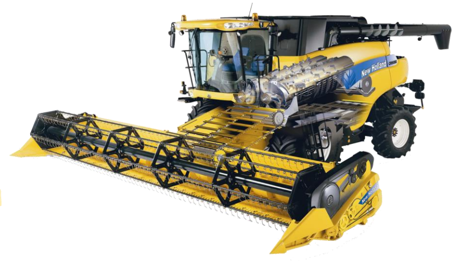
New Holland CR 9000: Doorsnede van een hedendaagse combine