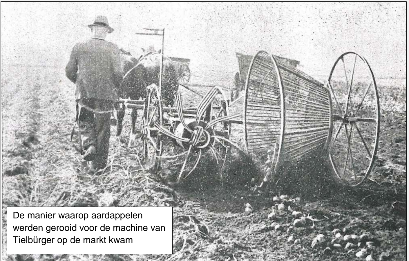
De manier waarop aardappelen werden geroid voor de machine van Tielbürger op de markt kwam