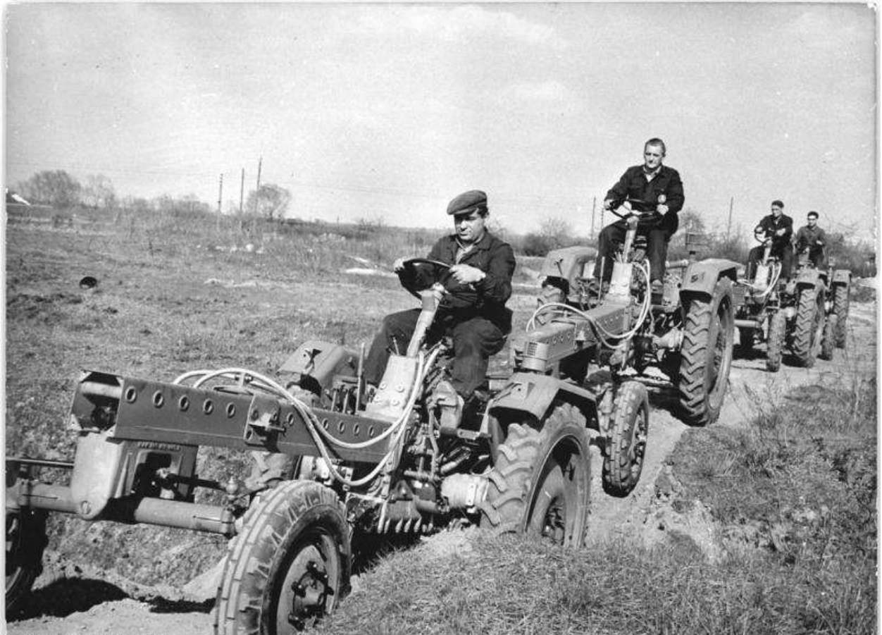
5. April 1960