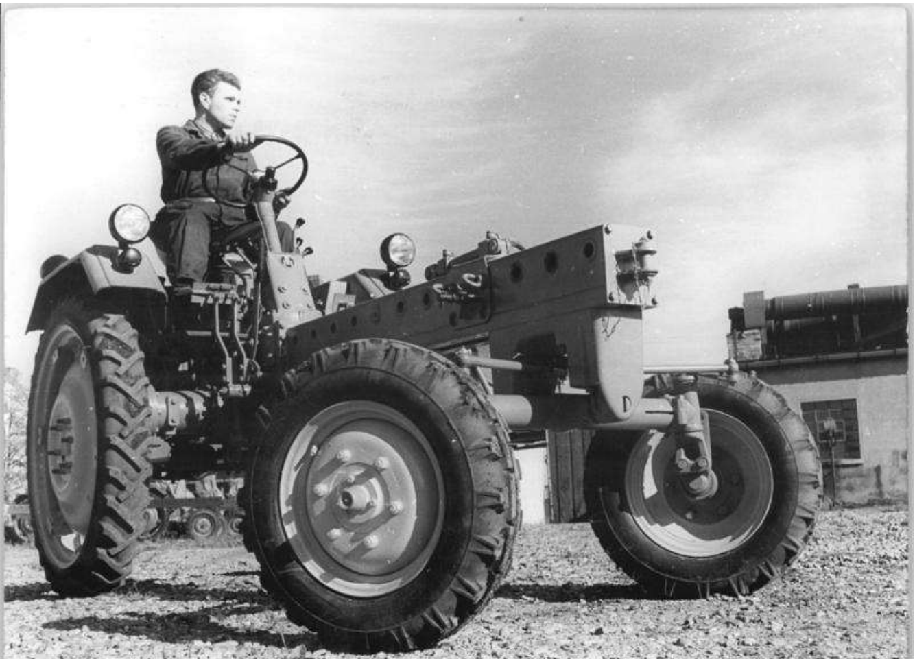
1. Oktober 1957