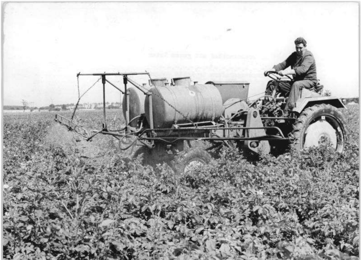
11. August 1961